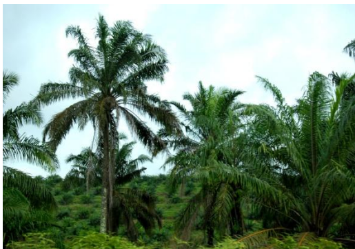
Palmolie voor oerwoud

Regelmatig worden er avonden of middagen georganiseerd waar gekeken, geluisterd en gediscussieerd wordt n.a.v. presentaties van verschillende aard.