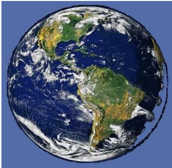
Zorg voor de schepping